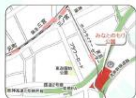
※会場へは公共交通機関でお越しください

戦争させない、9条壊すな! 総がかり行動兵庫実行委員会(略称:総がかり行動兵庫) 連絡先:中神戸法律事務所 TEL. 078-341-3332 FAX. 078-361-9990 e-mail: sougakarihyogo@gmail.com