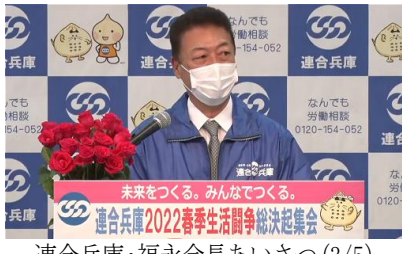
連合兵庫・福永会長あいさつ(3/5)

央集会も行われました（いずれもオンライン開催）。 兵高教も執行部を中心にこれらの集会に参加し、働くなかまと連帯してとりくみをすすめることを確認しました。