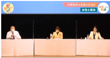
パネルディスカッション「女性と政治」(3/8)